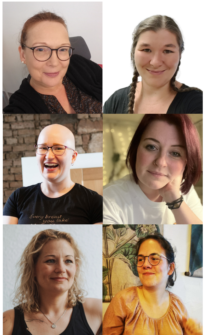
Dein Orgateam (oben) und der Bundesvorstand